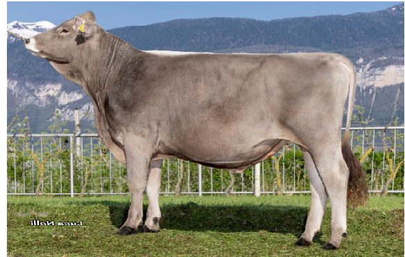
SUPERBROWN STIER SELECT

Südtiroler Braunviehzuchtverband Galvanistraße 38 39100 Bozen Tel. 0471/063800 Fax 0471/063801 info@braunvieh.it – www.braunvieh.it