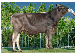
JELLY SUPERBROWN CM JELLY 011T024990577294 JAGUAR-CH x HURAY x ALIBABA Geburtsdatum: 14.03.2017