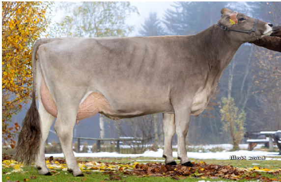
SUPERBROWN STIER BLOXOY