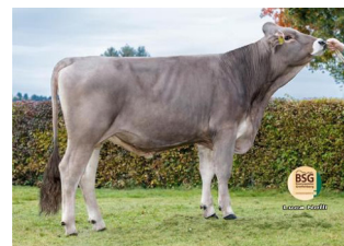
PLATIN PLATIN DE000955411514 PIANO x HIDALGO x VAPIANO Geburtsdatum: 10.10.2020