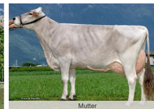
SYNTEC SUPERBROWN BODENGO SYNTEC 011T014990150540 SINATRA x DUBFIRE x PAYSSLI Geburtsdatum: 16.04.2018