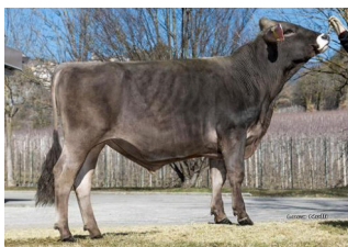
SILVANER SUPERBROWN SILVANER 011T021002529003 SEVILLA x VASSLI x ZONTA Geburtsdatum: 05.12.2021 Gesextes Sperma verfügbar