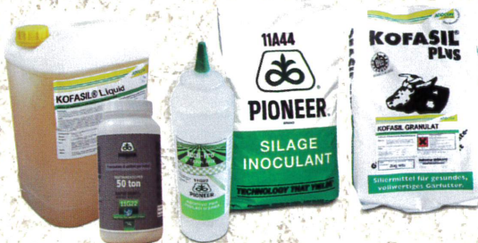
SILIERHILFSMITTEL Kofasil und Pioneer

Jetzt bestellen mit FRÜHBEZUGSRABATT und größtmöglicher Auswahl!