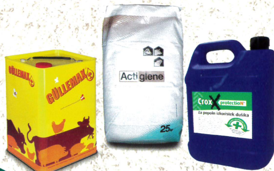
GÜLLEZUSÄTZE Actiglène, Güllemax, CroxxProtection – Nitrifikationshemmer