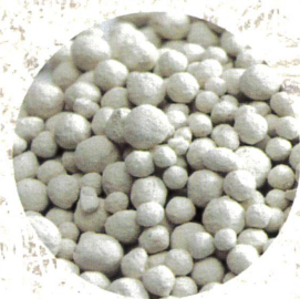
KALKDÜNGER Algenkalk, Magnesiumkalk, Kohlensaurer Kalk