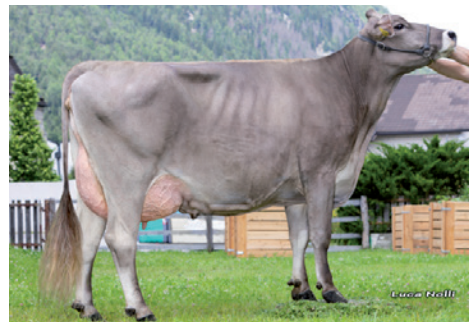
Fanny, die Mutter von Poseidon